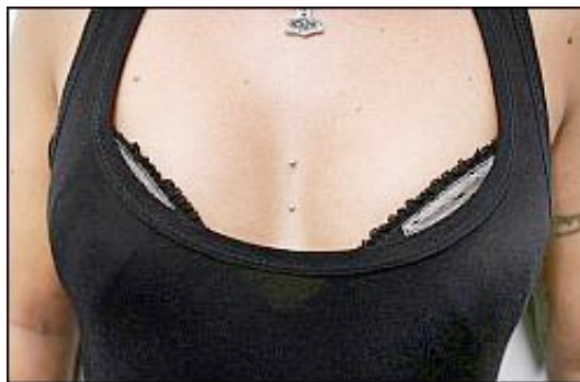
Der neue Piercingtrend Dermal Anchoring setzt Glanzlichter auf die Haut – alleine oder zur Verschönerung eines Tattoos.